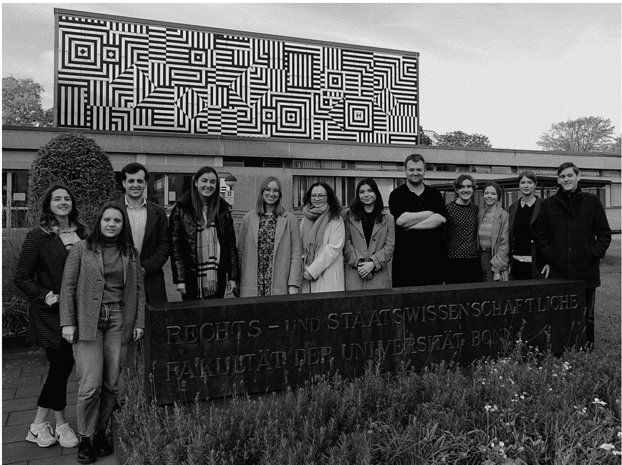
Die Redaktion im Oktober 2023

Ehrenamt ist Arbeit – aber das Bonner Rechtsjournal ist dabei für uns alle etwas ganz Besonderes. Durch die Tätigkeit in der Redaktion kann man schon während des Studiums in die wissenschaftliche Welt und außerdem in die Redaktionsarbeit einer wissenschaftlichen Publikation ein-